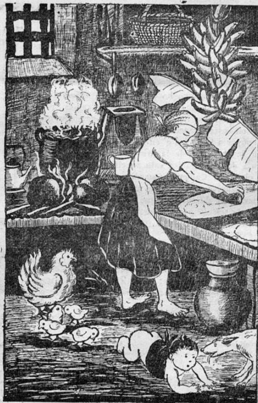
LA COCINA TIPICA COSTARRICENSE, DONDE SE SAZONAN LAS MAS EXQUISITAS VIANDAS — FABRICA NACIONAL DE LICORES —